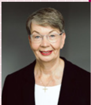
Landesbischöfin Kristina Kühnbaum-Schmidt Landesbischöfin der Evangelisch-Lutherischen Kirche in Norddeutschland und EKD-Schöpfungsbeauftragte